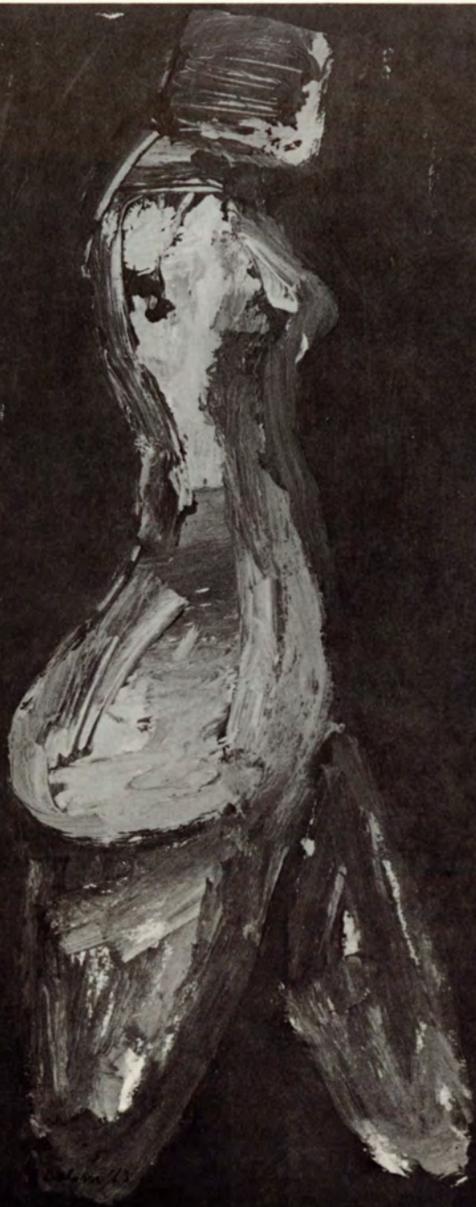
12. Mujer caminando