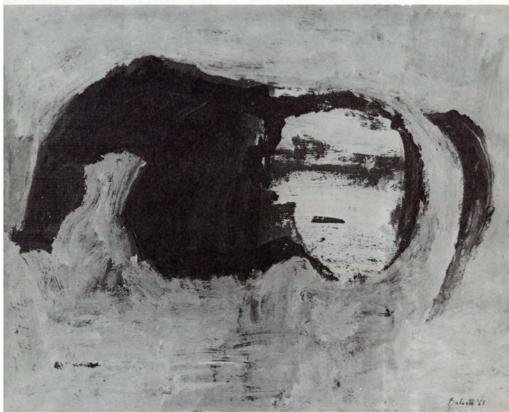
17. Caballo y jinete (Núm. 1)