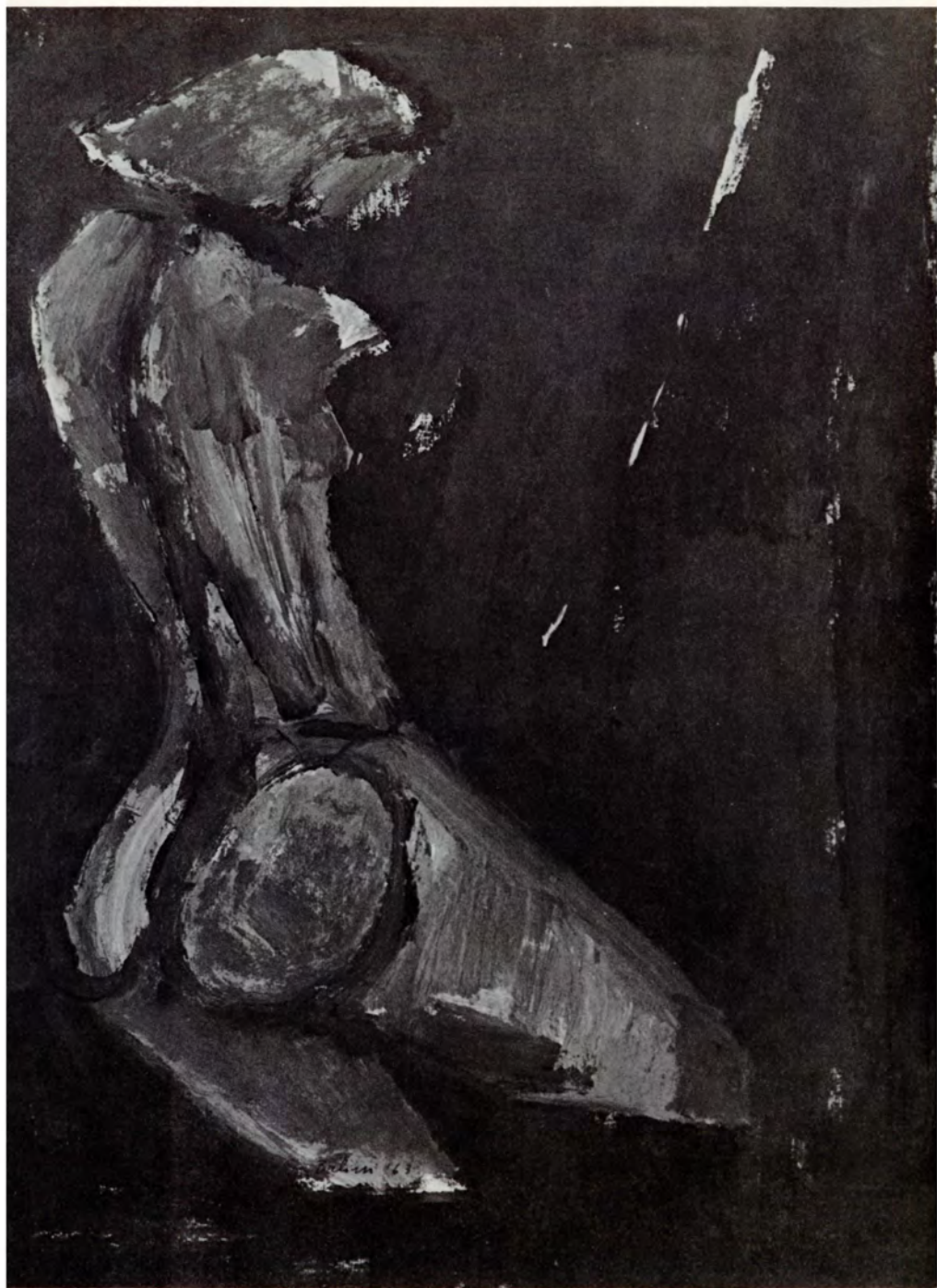
8. Mujer en columpio