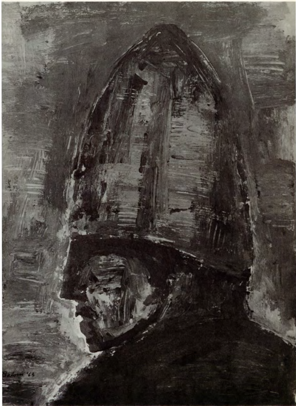
33. Soldado Núm. 1