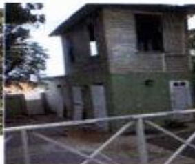
Ilustración #3: Detalles de los cambios y deterioro de la Casa del Poeta