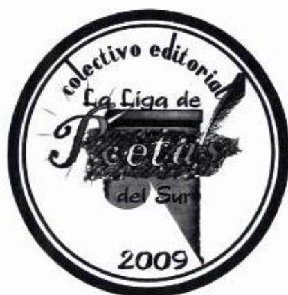
Ilustración #6: Sello del Colectivo Editorial de la Liga